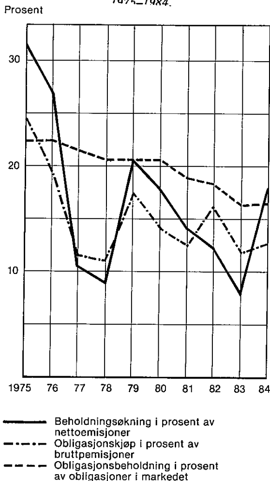
Fig. 2. Fondsforvaltningens andel av det norske ihendehaverobligasjonsmarked 1975-1984.